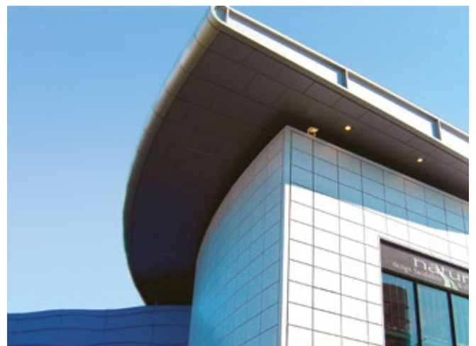
Centre Commercial Odysseum (34 MONTPELLIER) Design International et DGLa | CASTEL ET FROMAGET