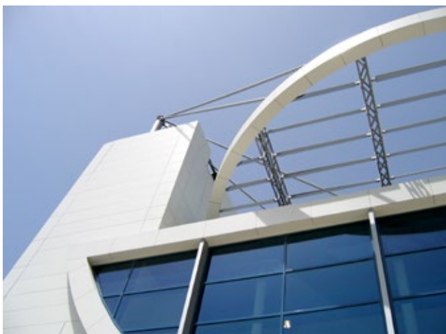
Station d'Épuration de Vitrolles (13 VITROLLES) Christian Cazenave | ASTEN