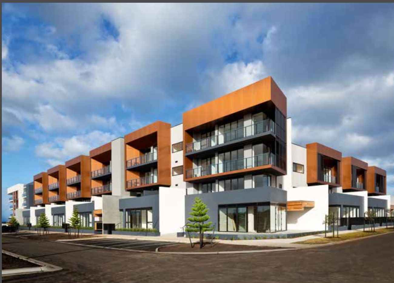
Wyndham Harbour, Australie | Architecte : Fender Katsalidis | Matériau : ALUCOBOND® PLUS naturAL Copper | © Angus Martin Wyndham Harbour, Australia | Architetto: Fender Katsalidis | Materiale: ALUCOBOND® PLUS naturAL Copper | © Angus Martin